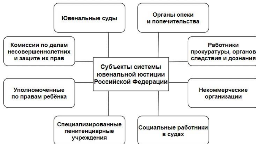
Рисунок 1 – Субъекты системы ювенальной юстиции Российской Федерации

от 14.02.2005, система ювенальной юстиции – совокупность государственных органов, органов местного самоуправления, государственных и муниципальных учреждений, должностных лиц, а также неправительственных некоммерческих организаций, осуществляющих на основе установленных законом процедур действия, нацеленные на реализацию и обеспечение прав, свобод и законных интересов несовершеннолетних [2]. Субъекты системы ювенальной юстиции Российской Федерации представлены ниже на рисунке 1.